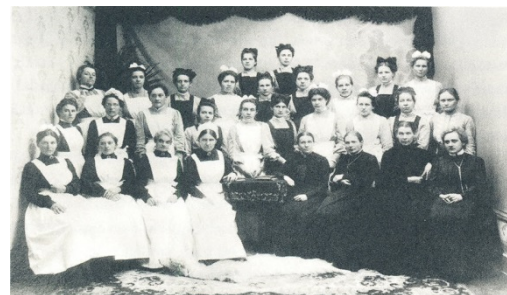
Diplomfeier an der Schule in Zürich